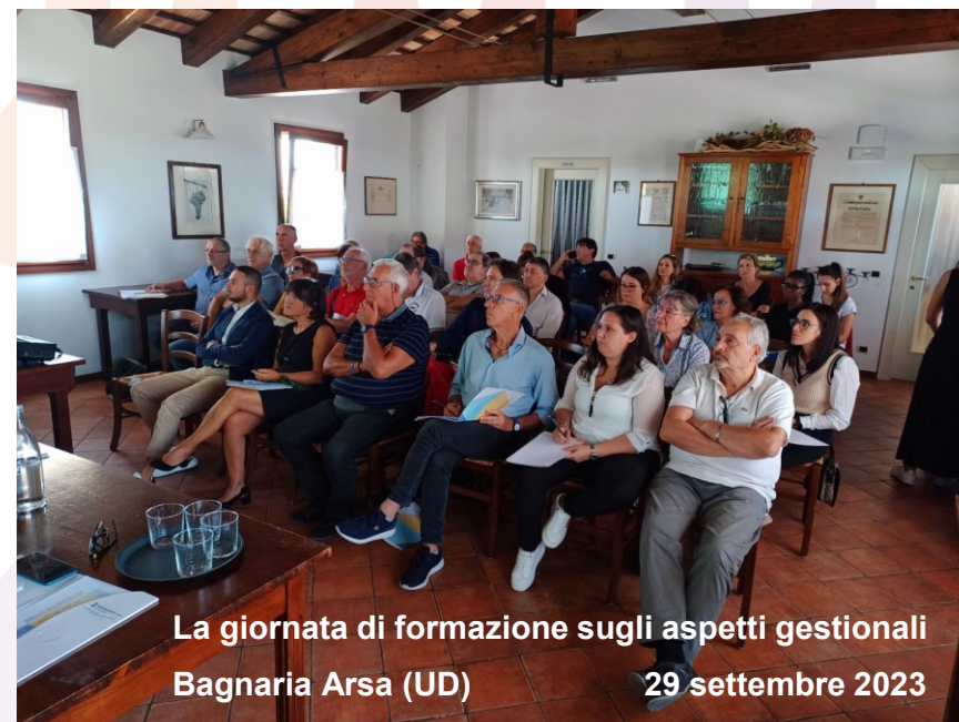
La giornata di formazione sugli aspetti gestionali Bagnaria Arsa (UD) 29 settembre 2023